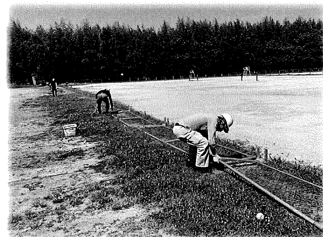
木津川運動広場撤去訓練